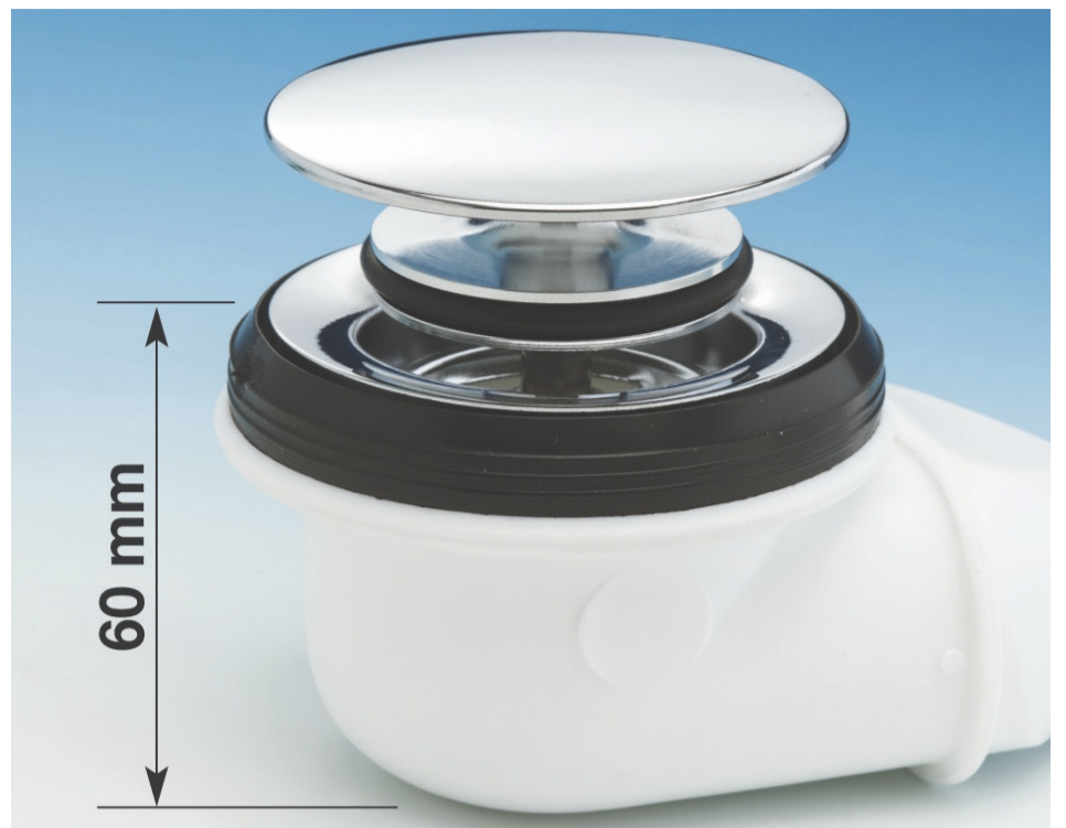
LA PILETTA Basket Bagno Bassa dalla ridotta altezza di soli 60 mm.